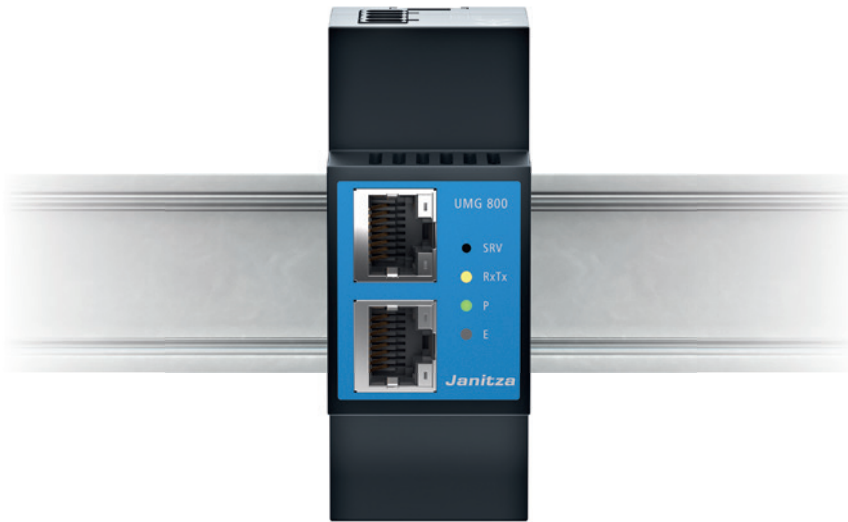
Basisgerät UMG 800 Artikel-Nr.: 5238001