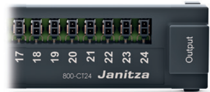
Strommessmodul 800-CT24 Artikel-Nr.: 5231247